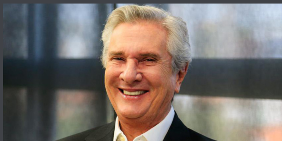
Fernando Collor de Mello

Conversas com Presidentes da República sobre os marcos da política externa de seus governos