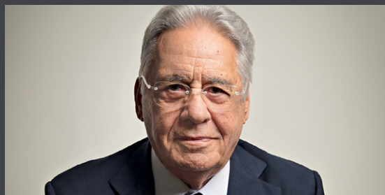
Fernando Henrique Cardoso